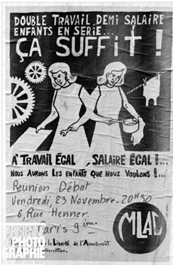
Source : Affiche du M.L.A.C. (Mouvement pour la liberté de l'avortement et la contraception). Paris, 1973. © Roger-Viollet (photographie en ligne sur le site www.parisenimages.fr )