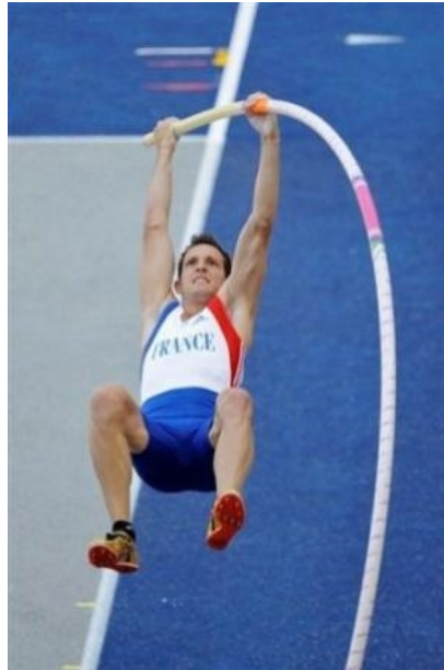
Renaud Lavillenie, médaille de bronze aux championnats du monde à Daewu avec 5m90