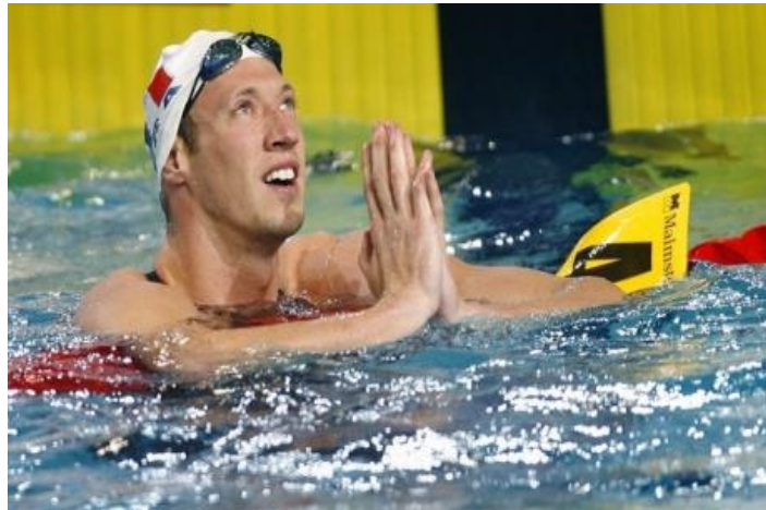
Alain Bernard, champion olympique du 100m nage libre à Pékin en 47''21

Retrouver par des arguments physiques la vitesse que peut atteindre un nageur délivrant toute sa puissance physique. Pour répondre à la question, on fournit quelques indications relatives à la force subie par un objet en mouvement dans un fluide (force de trainée) ainsi que des ordres de grandeur de puissance développée.